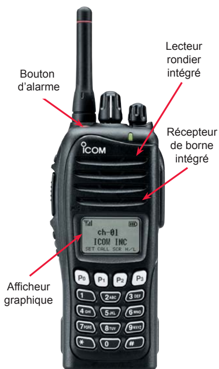
▲ Portatif radio présenté avec antenne courte (option) et clavier. Existe en version sans clavier.

Ces portatifs sont conçus pour des utilisateurs ayant des besoins de localisation en milieux fermés (bâtiments, hangars, etc...) et pour lesquels les systèmes traditionnels de positionnement par GPS ne sont pas adaptés.