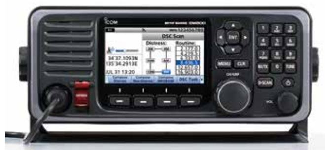
Caractéristiques techniques p.75 Accessoires p.26