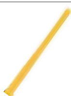
Antenne flexible 156-163 MHz type J