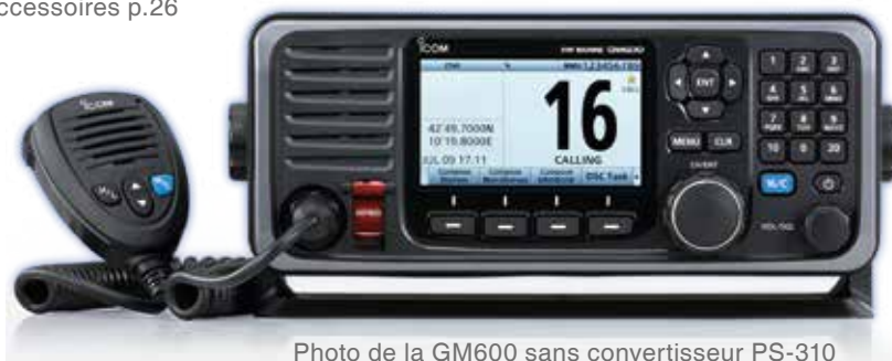
Photo de la GM600 sans convertisseur PS-310