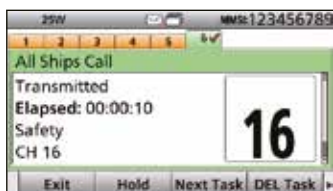
Écran mode ASN multitâche