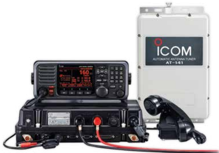
Photo du PACK-GM800 livré avec combiné HS-98 et coupleur automatique d'antenne AT-141