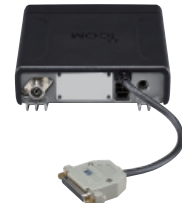
Installation du câble Sub-D 25 broches OPC-2078 en option