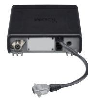
Installation du câble Sub-D 15 broches OPC-1939 en option