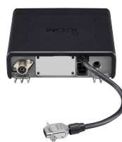
Installation du câble Sub-D 15 broches OPC-1939 en option