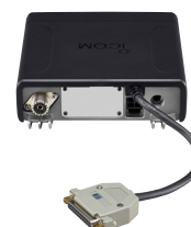
Installation du câble Sub-D 25 broches OPC-2078 en option