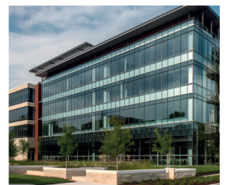
Bâtiments publics, hôpitaux...