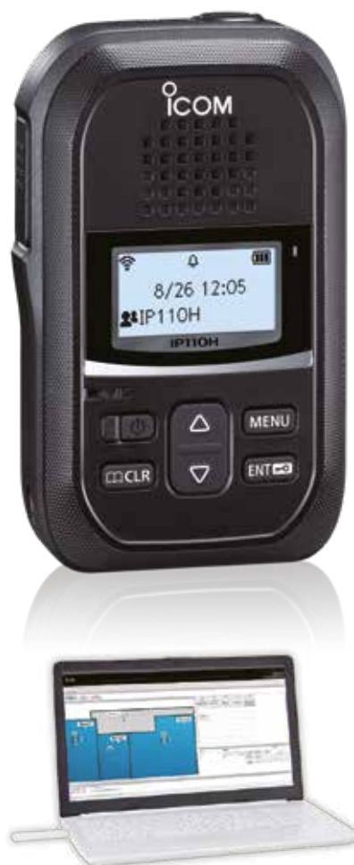
Application de gestion par PC IP-100FS