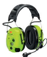
Large choix de casques. Nous consulter.

Casques PELTOR bluetooth ou filaire actifs ou passifs . Idéal dans les environnements très bruyants.